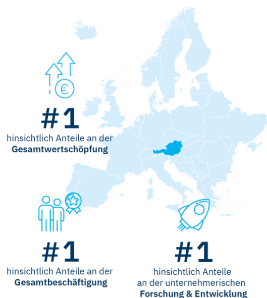
Abbildung 3: Österreich im Vergleich zu den EU-27 (diverse Quellen)